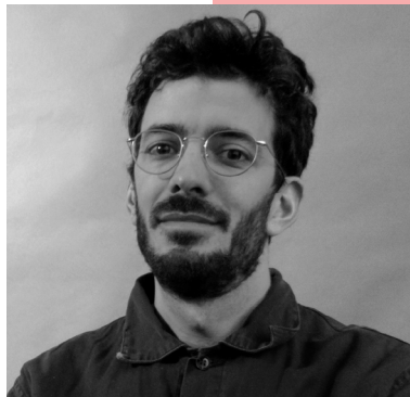
GIULIO CALLEGARI AUTEUR